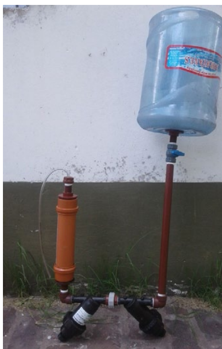
Figura 3. Adaptación de un equipo clorinator con filtros, mallas y cartucho con carbón activado