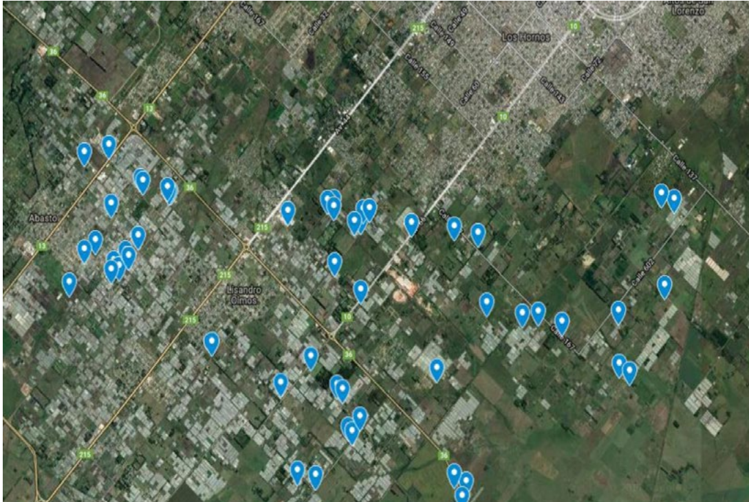
Figura 2. Ubicación espacial de las quintas platenses en donde se llevó a cabo la toma de muestra de agua

Para todos los análisis de laboratorio se siguió el manual Standard Methods for the Examination of Water and Wastewater (Rice, Baird & Eaton, 2017).