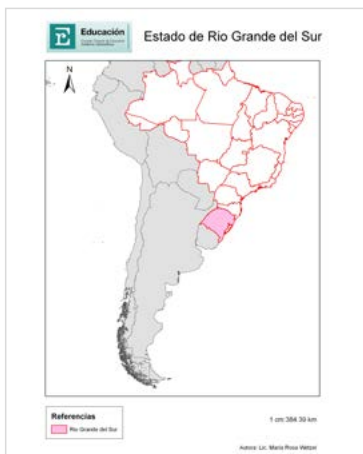
Figura N° 3. Mapa político de Brasil. Ubicación territorial de Río Grande do Sul.