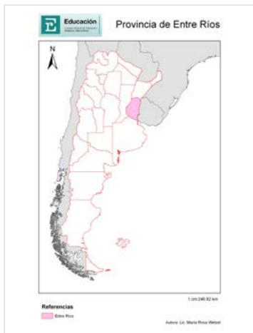
Figura N° 1. Mapa político de la República Argentina, ubicación de la Provincia de Entre Ríos.