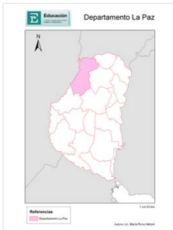
Figura N° 2. Mapa político de la Provincia de Entre Ríos, ubicación del Departamento La Paz.